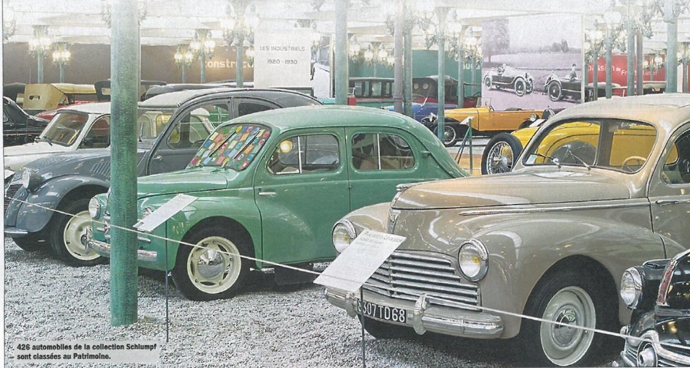
426 automobiles de la collection Schlumpf sont classées au Patrimoine.