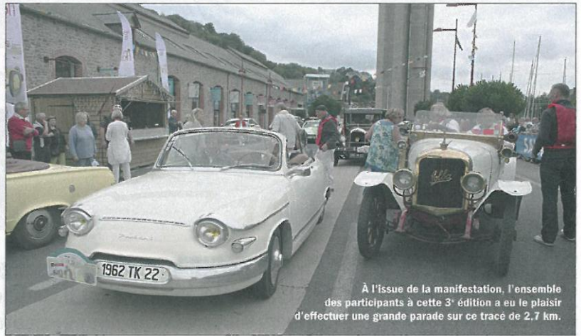
À l'issue de la manifestation, l'ensemble des participants à cette 3 e édition de la Coupe Florio a eu le plaisir d'effectuer une grande parade sur ce tracé de 2,7 km.